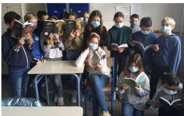
Des élèves attentifs de la 6 ème Olympie

Nous avons d'abord passé un test « Quel lecteur es-tu ? » pour mieux apprendre à nous connaître.